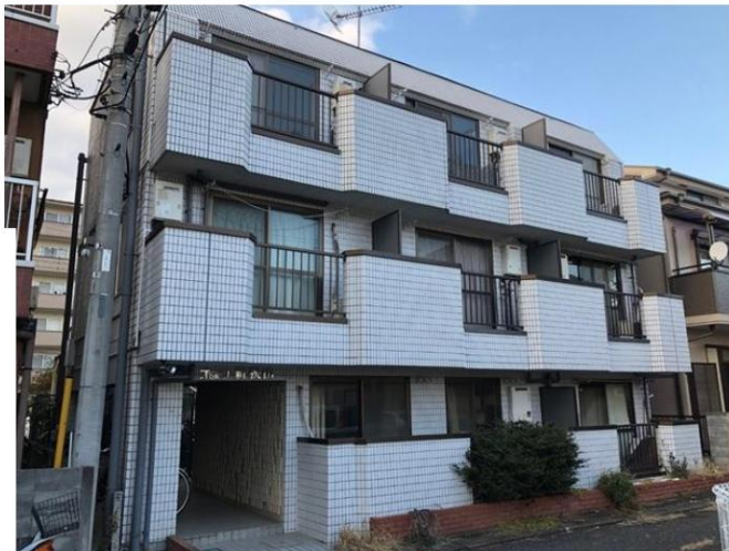
■レントロール表(オーク新狭山)