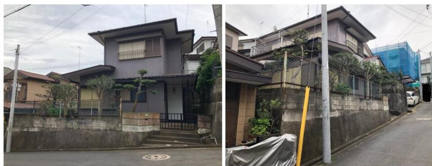
※図面と現況が異なる場合は現況を優先します。