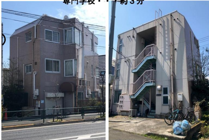
■レントロール表(メゾンK&M)